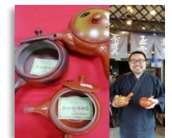
Bintsukeya Tealeaf Shop