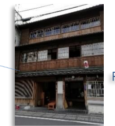
TAKEYA Eel Restaurant