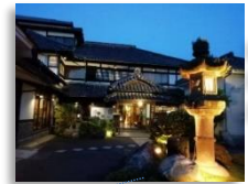
WATAYA Ryokan & Hot spring