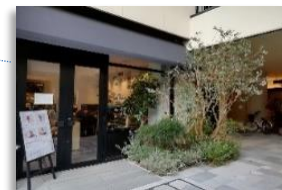
KARAE Hotel Theater, shop, Cafe