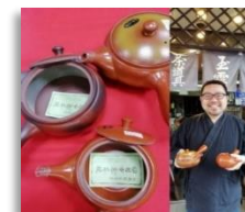
Bintsukeya Tealeaf Shop