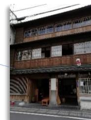
TAKEYA Eel Restaurant