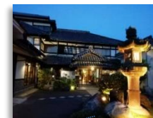
WATAYA Ryokan & Hot Spring