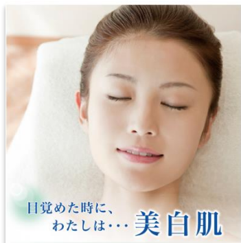
目覚めた時に、わたしは... 美白肌

唐津に来たら美肌になって帰ってください。移動中の乗り物の中は乾燥しています。1時間でお肌が回復します。