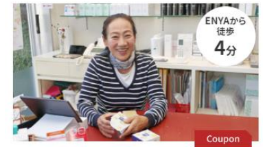
キヌヤコスメティックス HerB

毎年恒例となっている街の映画館ENYA映画 祭へ2021年から毎年応募。当店のお客さま に映画チケットを配布。唐津を映画の街カン ヌのようににしたいとサポーターとして応援中。