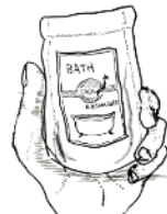
BATH Epsom-salt with SAGA Essential-Oil