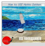
イラスト発酵せっけん使い方