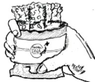
Hakko Wagran (SAKEKASU-granola gluten-free) for health concious people