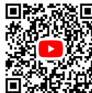
YouTube登録チャンネルはこちら YouTube