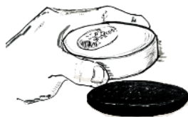
SAGA Hakko Sekken With Art of Conscious living Karatsuware soap-tray

キヌヤ発酵ラボは、2022年2月22日に有限会社キヌヤコスメティックス内に開設した事業部です。目的は皆さまへより良い日本の麹菌を使った商品を 地域産生産 パートナーと 専門的 に開発するためです。 安心な安全で、皆さまの生活が 楽しく整う 商品をお届けします。