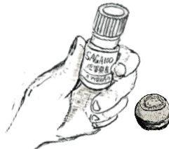
SAGA100% Organic Essential-Oil With Karatsuware Aroma-stone