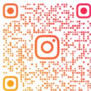
キヌヤ発酵ラボのInstagramはこちら Instagram

キヌヤ発酵ラボ の ショート動画です。 QRコードスキャン またはタップして 動画を楽しまйте。